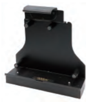
Station d'accueil de bureau