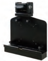
Station d'accueil pour véhicule