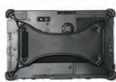
Sangle en X