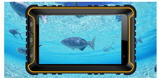
OGS - One Glass Solution Sunlight Readable